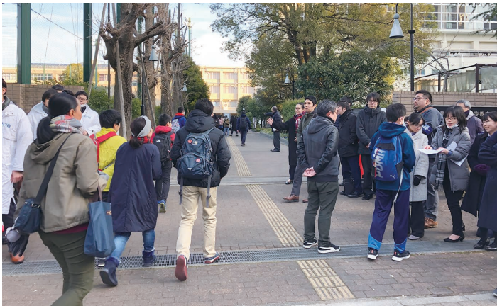
都立南多摩中等教育学校

記述問題はいかに相手に分かりやすく伝えようとするかがポイントです。できるだけシンプルに1文をまとめるように意識してみましょう。私立中も受験する方は何日間か試験が続きますので、体調管理には一層気をつけてください。みんな頑張ってください。心から健闘を祈っています。