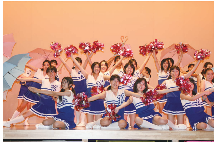
晃華学園中・高・文化祭

また9月中旬からは、各中学校で入試説明会や文化祭、体育祭などの行事がたくさん開催されます。各中学校の生の姿に触れることができる絶好のチャンスです。ぜひできるだけ多くの学校の行事に参加し、じっくりと比較検討してみてください。