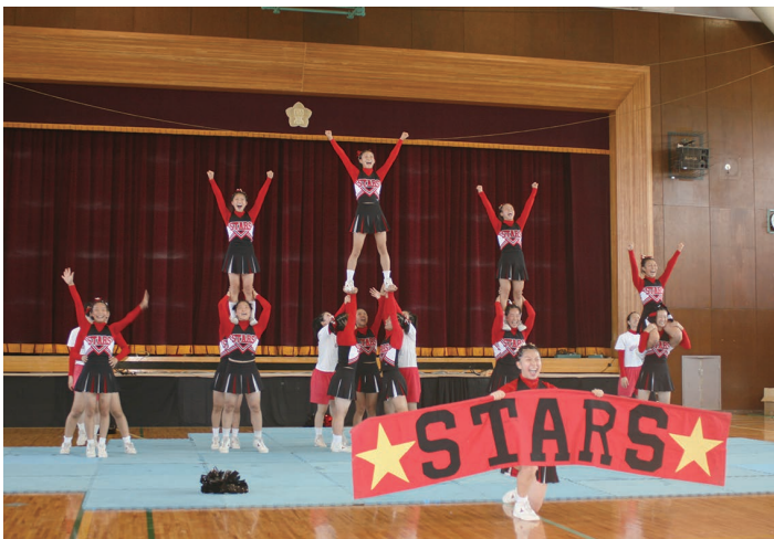
都立国立高校・文化祭

適性Ⅱ対策 …どの問題でも、文章や図表の中に解き方やヒントが書かれています。大事な部分や単位などには線を引きながら、最後まで注意深く読み通してみよう。