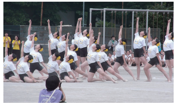
桐朋女子中・高・体育祭