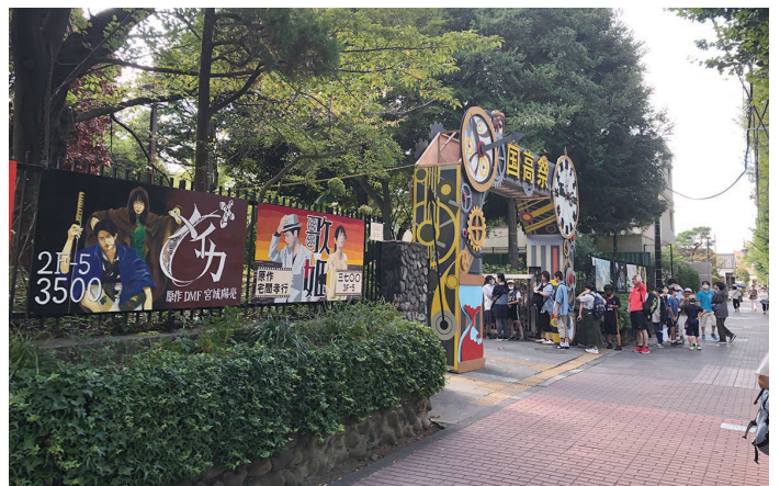
都立国立高校・文化祭

また今年もまだコロナの影響もあり、体育祭は非公開、文化祭や説明会さえも事前予約が必要という学校が多いので、こまめにHPをチェックして、申込み損なうことがないよう、細心の注意を払ってください。